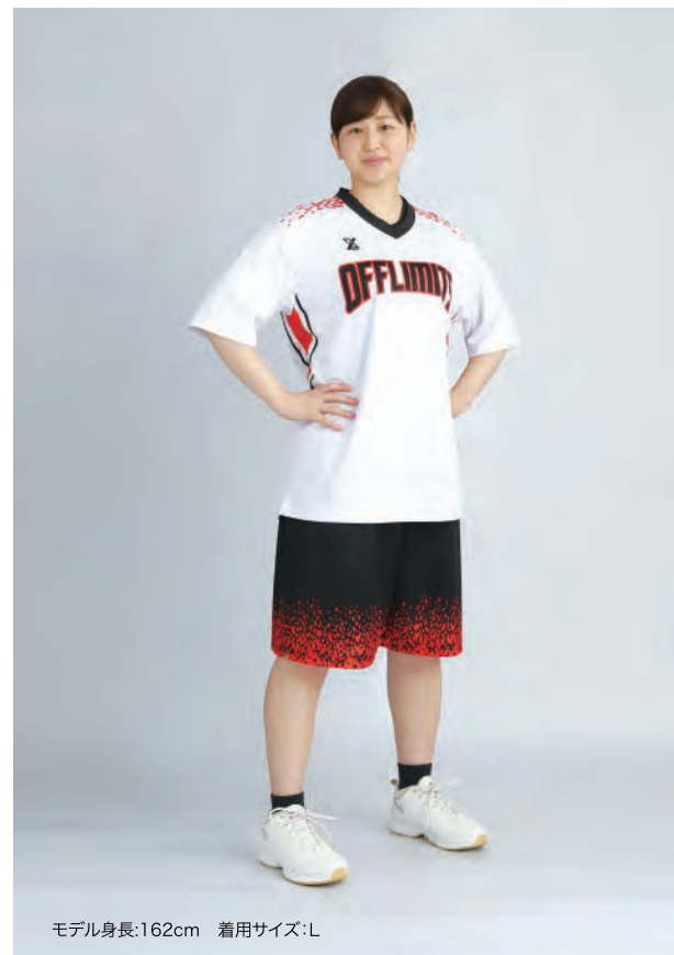
モデル身長:162cm 着用サイズ:L