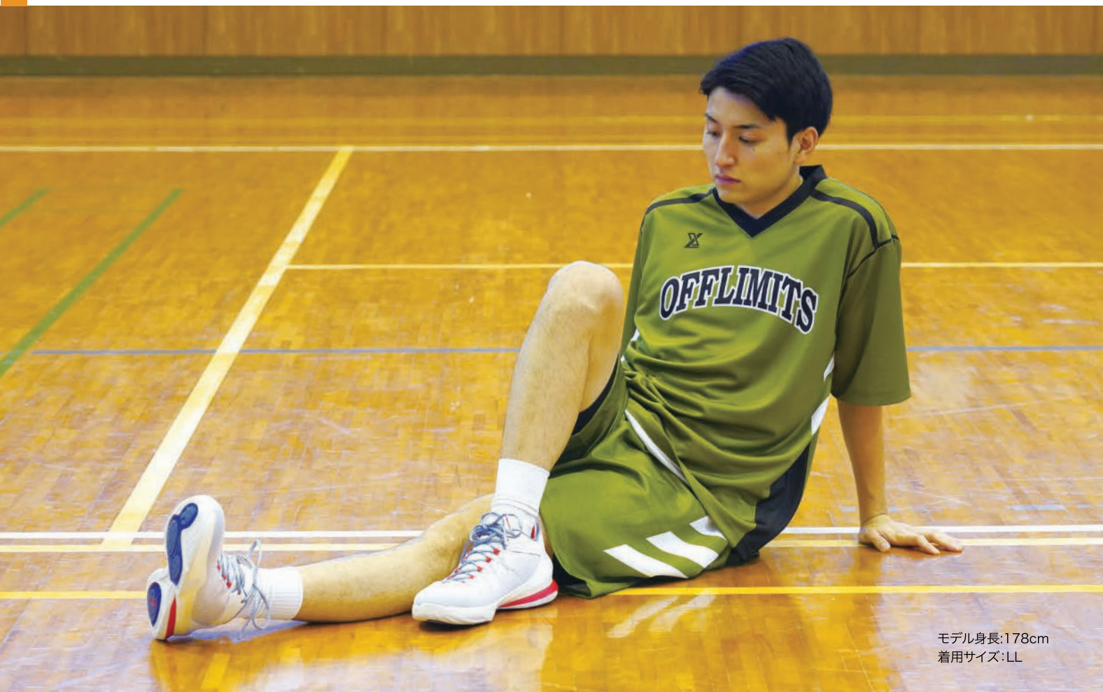
モデル身長:178cm 着用サイズ:LL