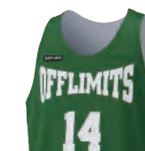
タンクトップシャツ

カットスリーブよりも肩幅が狭めのシャツタイプ 肩周りの可動域の制限がなく、着心地良好。