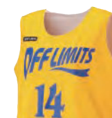
レディースシャツ

カットスリーブよりも首・袖口が狭めのシャツタイプ インナーが見えるという懸念を軽減。