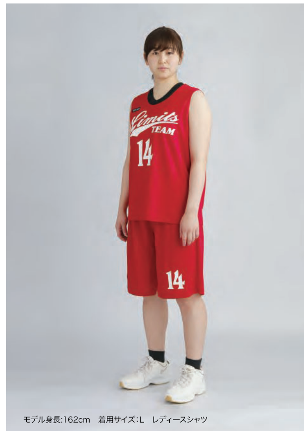
モデル身長:162cm 着用サイズ:L レディースシャツ