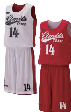
レディースシャツ

徹底的にシンプルな仕様で低価格を実現。 とにかく安価のリバーシブルウェアをお探し の方はこちらの商品がおすすめ。