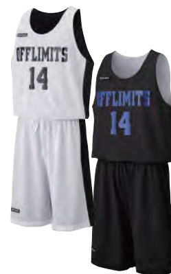
タンクトップシャツ