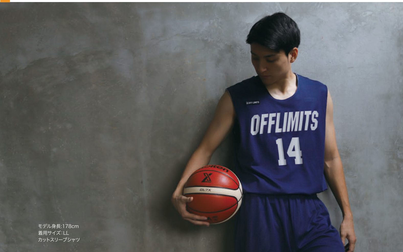
モデル身長:178cm 着用サイズ:LL カットスリーブシャツ