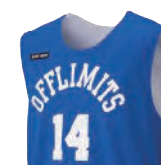
カットスリーブシャツ

肩幅のあるベーシックなシャツタイプ Tシャツの上から着用する場合、 女性チームにもこちらがおすすめ。