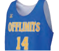
タンクトップシャツ

カットスリーブよりも肩幅が狭めのシャツタイプ 肩周りの可動域の制限がなく、着心地良好。