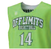
カットスリーブシャツ

肩幅のあるベーシックなシャツタイプ Tシャツの上から着用する場合、 女性チームにもこちらがおすすめ。