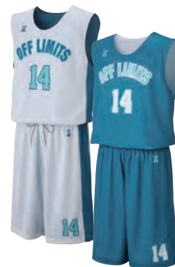
カットスリーブシャツ

今や主流の昇華プリントリバーシブル。 インクを生地に染み込ませてデザインを表現 しているため、軽量で通気性の良い快適な 着心地。