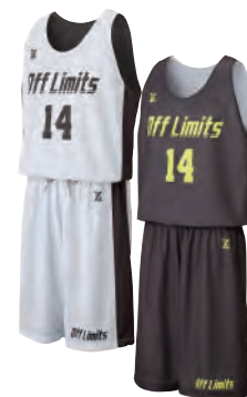
タンクトップシャツ