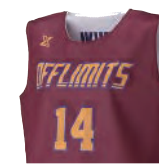
レディースシャツ

カットスリーブよりも首・袖口が狭めのシャツタイプ インナーが見えるという懸念を軽減。