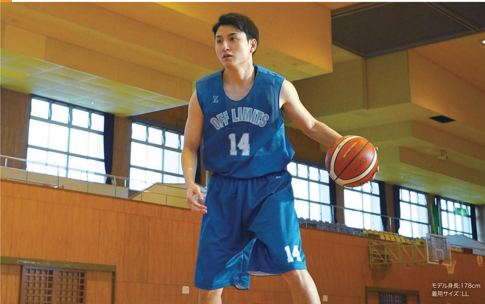
モデル身長:178cm 着用サイズ:LL