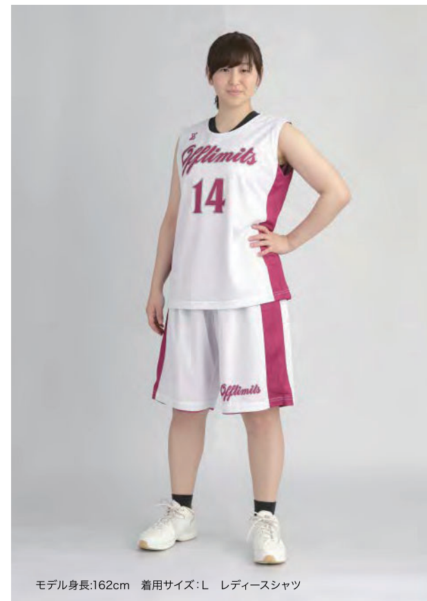
モデル身長:162cm 着用サイズ:L レディースシャツ