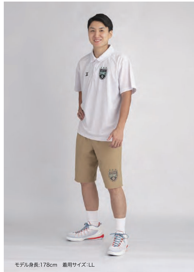
モデル身長:178cm 着用サイズ:LL