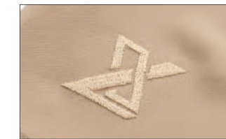
ブランドロゴ刺繍