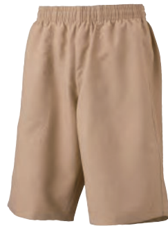
チノショートロゴなし

布帛(ふはく)生地を使用した柔らかな肌触り。丈感・太さなどの流行りのスッキリとしたシルエットにこだわりつつ、軽量な仕上がりに。