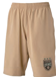
チノショートロゴあり