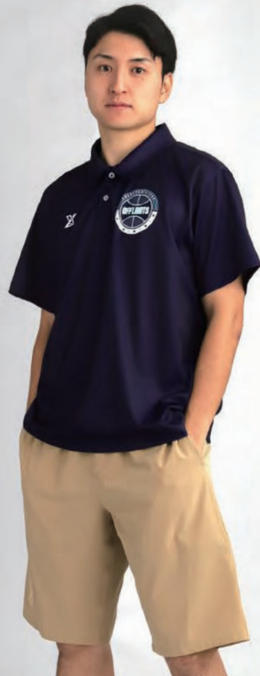
モデル身長:178cm ポロシャツ:LL チノショート:LL