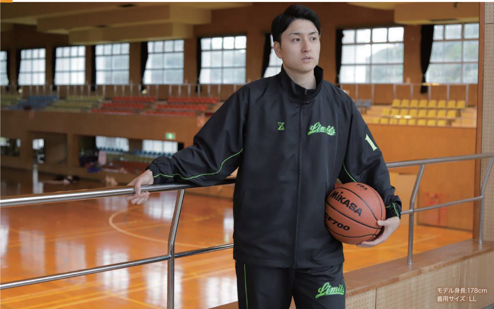
モデル身長:178cm 着用サイズ:LL