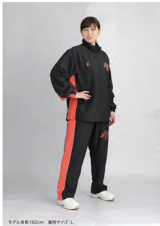
モデル身長:162cm 着用サイズ:L