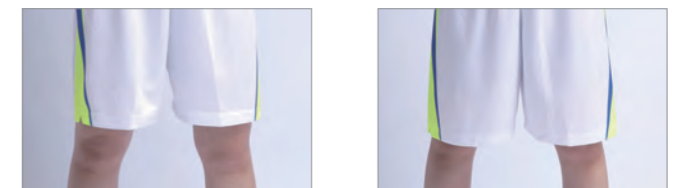
レギュラーパンツ

ユニフォーム規程に沿ったレギュラー丈、旧式のロング丈の2種類。同サイズを選んだときに丈の長さが4cm変わるので、チームに合った丈感を選択可能。