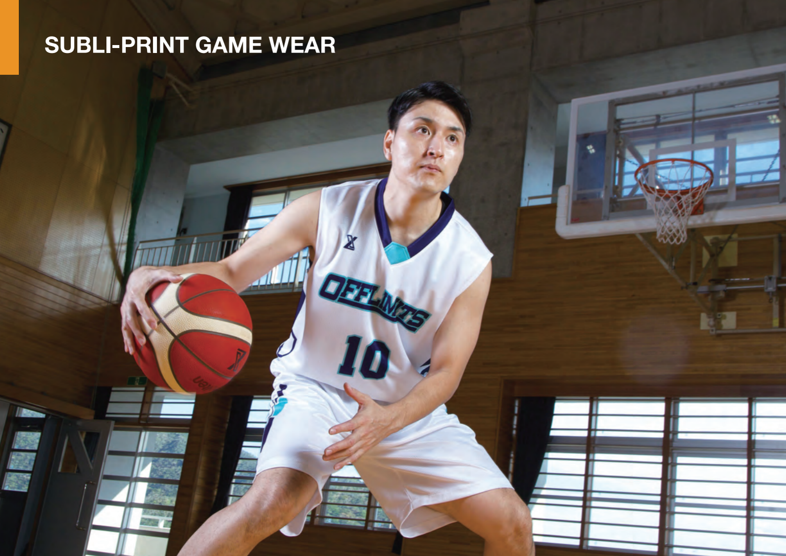
モデル身長:178cm 着用サイズ:LL レギュラーパンツ