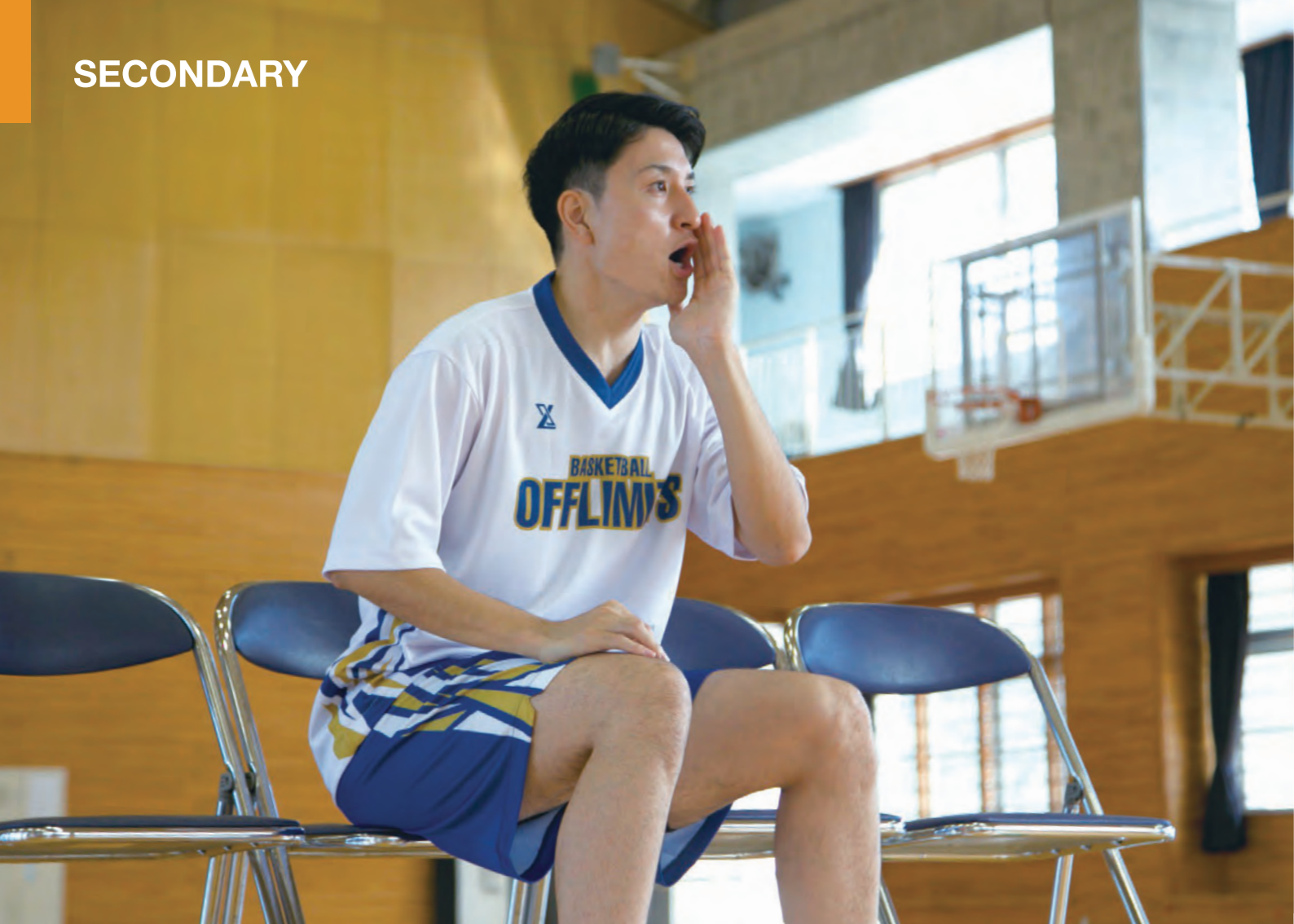
モデル身長:178cm 着用サイズ:LL