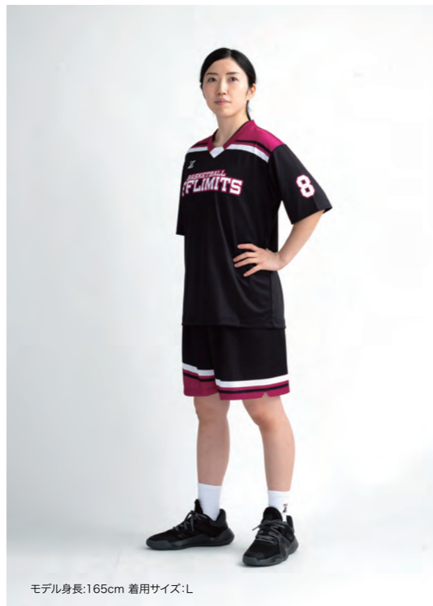
モデル身長:165cm 着用サイズ:L