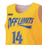
レディースシャツ

カットスリーブよりも首・袖口が狭めのシャツタイプ インナーが見えるという懸念を軽減。