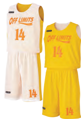
レディースシャツ