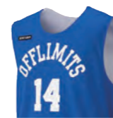
カットスリーブシャツ

肩幅のあるベーシックなシャツタイプ Tシャツの上から着用する場合、 女性チームにもこちらがおすすめ。