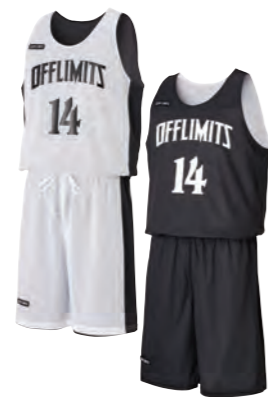
タンクトップシャツ

徹底的にシンプルな仕様で低価格を実現。 とにかく安価のリバーシブルウェアをお探し の方はこちらの商品がおすすめ。