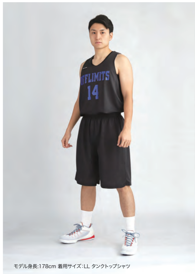
モデル身長:178cm 着用サイズ:LL タンクトップシャツ