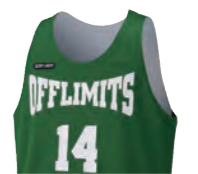
タンクトップシャツ

カットスリーブよりも肩幅が狭めのシャツタイプ 肩周りの可動域の制限がなく、着心地良好。