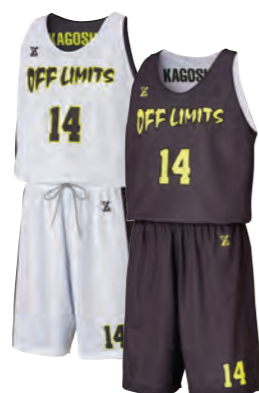
タンクトップシャツ

今や主流となっている昇華プリント、インクを生地に染み込ませて表現しているため、プリント部分の劣化がしにくい。軽量で通気性の良い快適な着心地。