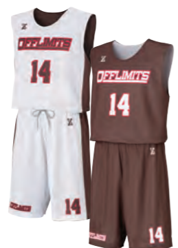
レディースシャツ