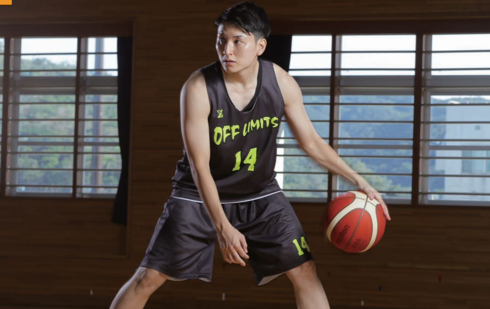
モデル身長:178cm 着用サイズ:LL タンクトップシャツ