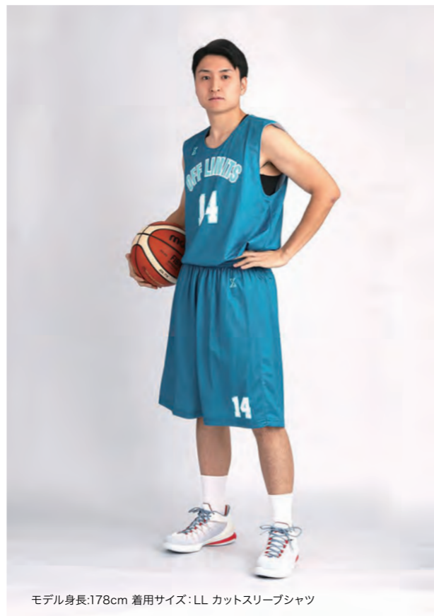
モデル身長:178cm 着用サイズ:LL カットスリーブシャツ