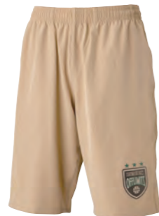
チノショートロゴあり