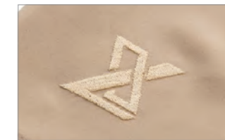
ブランドロゴ刺繍