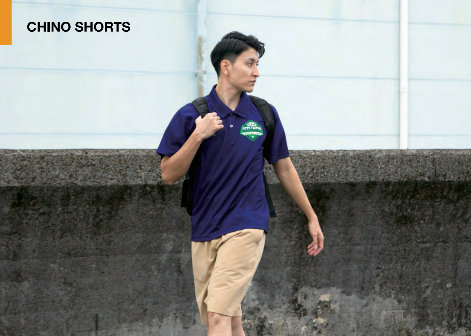
モデル身長:178cm 着用サイズ ポロシャツ:LL チノショート:LL