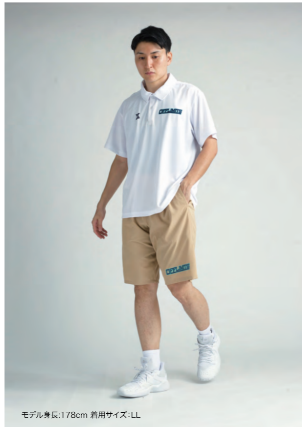
モデル身長:178cm 着用サイズ:LL