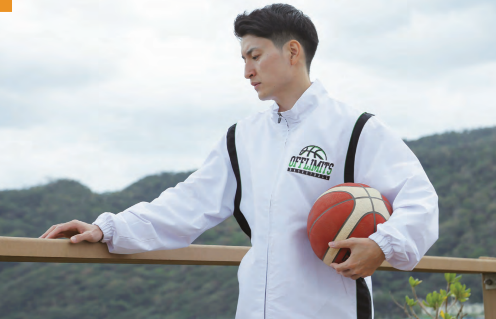
モデル身長:178cm 着用サイズ:LL