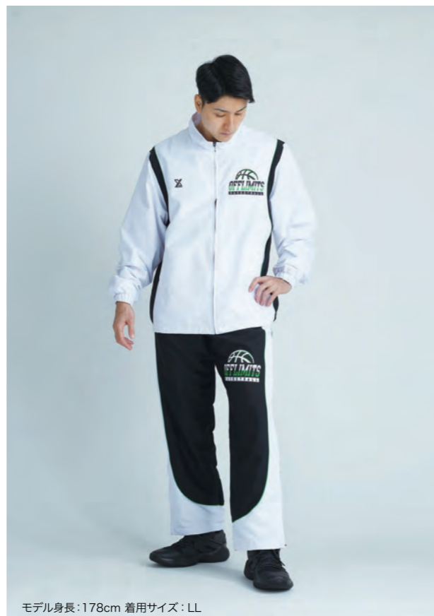
モデル身長:178cm 着用サイズ:LL