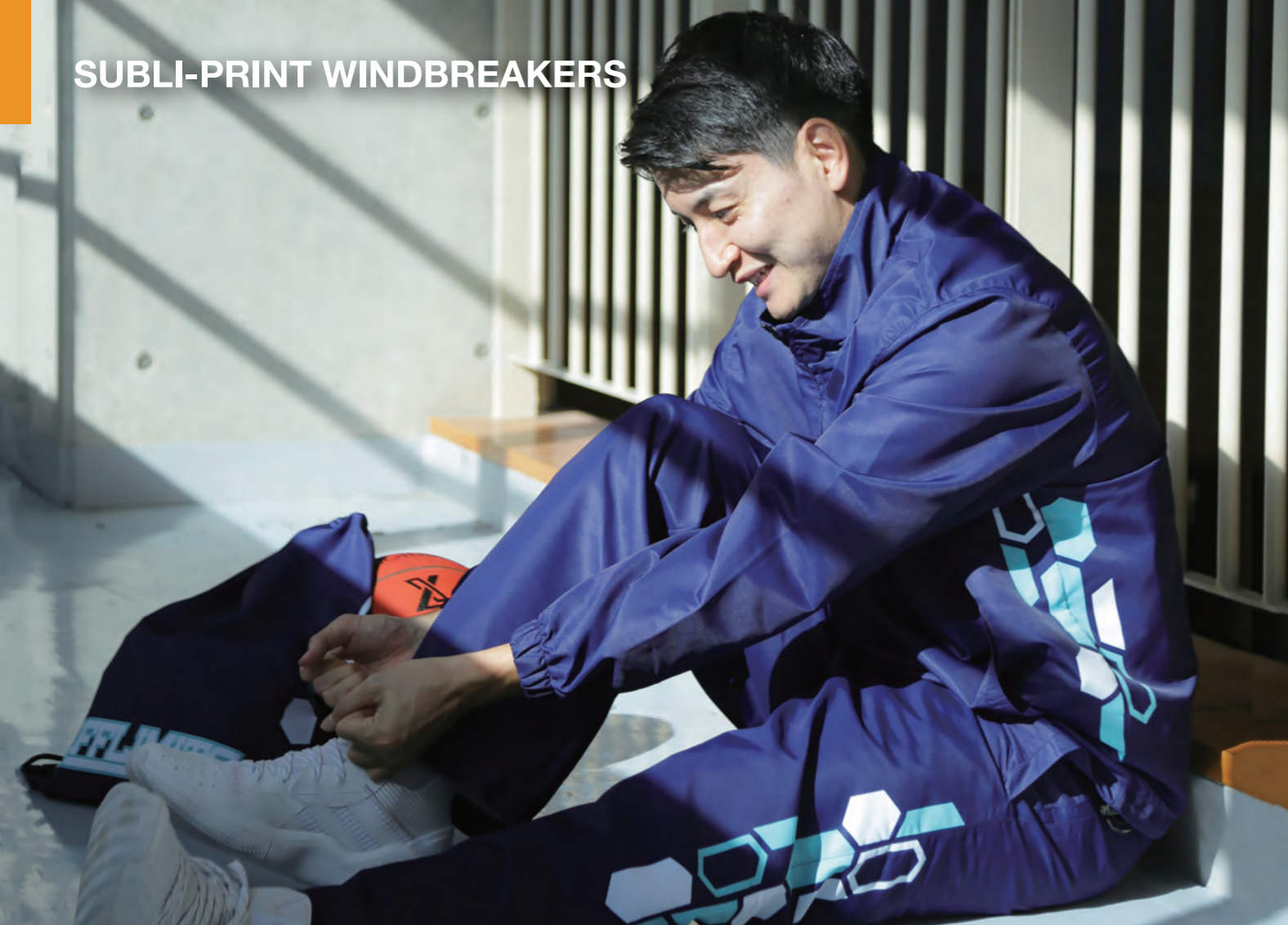
モデル身長:178cm ジャケット:LL パンツ:LL