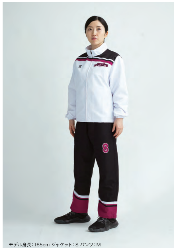
モデル身長:165cm ジャケット:S パンツ:M