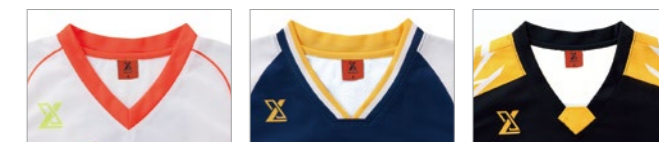
TYPE-A TYPE-B TYPE-C

ベースとなる襟の形は3種類。自由に配色することができ、ラインを入れることも可能。※襟部分も本体と同じ生地素材を使用。