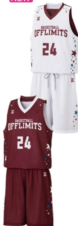
OLRV-059 タンクトップシャツ ①ホワイト②マルーン③コバルトブルー ①マルーン②ホワイト③コバルトブルー