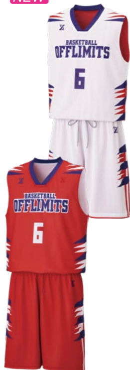
OLRV-060 カットスリーブシャツ ①ホワイト②レッド③パープル ①レッド②ホワイト③パープル