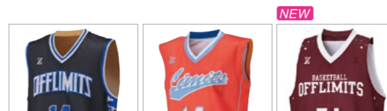
カットスリーブシャツ レディースシャツ タンクトップシャツ

カットスリーブ・レディースは、肩幅のあるベーシックなシャツタイプ。タンクトップは、肩周りの可動域に制限がない肩幅が狭めのシャツ。