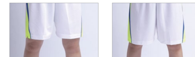
レギュラーパンツ

レギュラー丈、旧式のロング丈の2種類。同サイズを選んだときに丈の長さが4cm変わるのので、チームに合った丈感を選択可能。