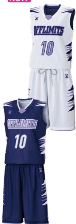
OLRV-060 レディースシャツ ①ホワイト②パープル③インディゴ ①インディゴ②パープル③ホワイト