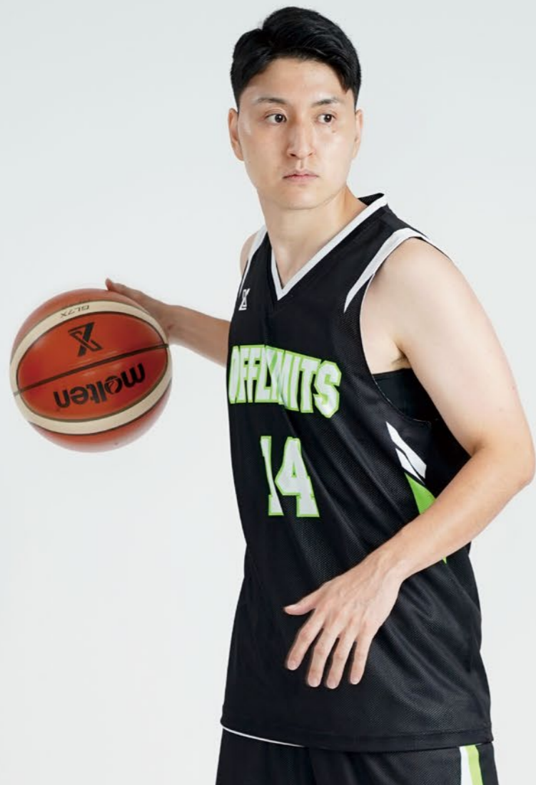
モデル身長:178cm 着用サイズ:上下LL タンクトップシャツ/レギュラーパンツ