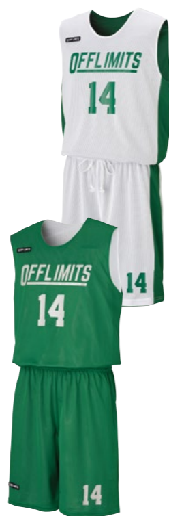
カットスリーブシャツ