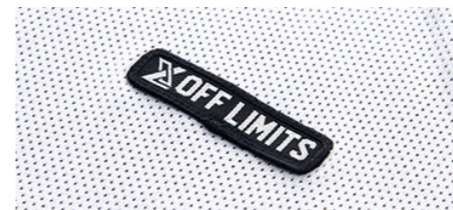
ブランドワッペン