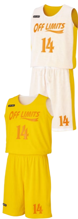
レディースシャツ