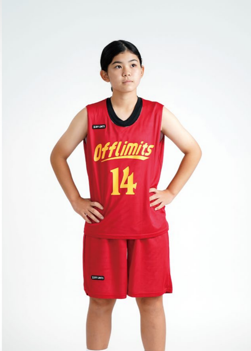
モデル身長:151cm 着用サイズ:上M,下S レディースシャツ