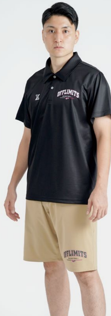
モデル身長:178cm 着用サイズ:LL