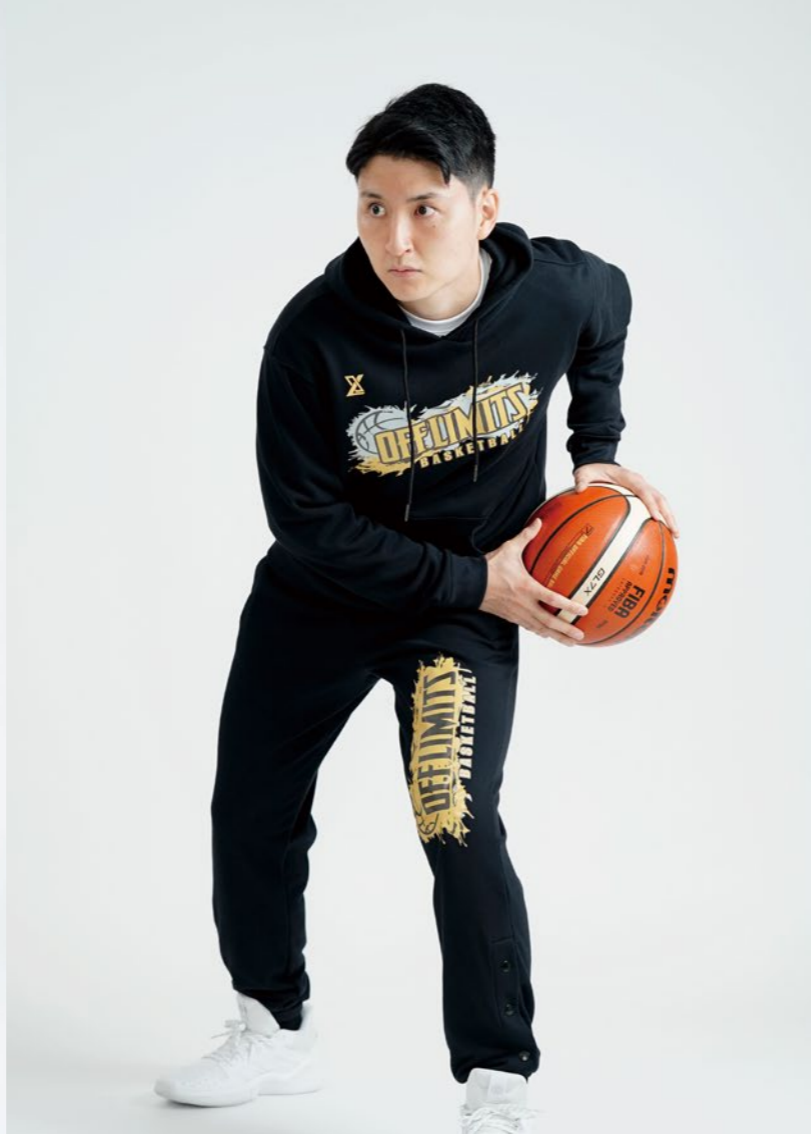
モデル身長:178cm 着用サイズ:上LL、下L パーカー・パンツセット