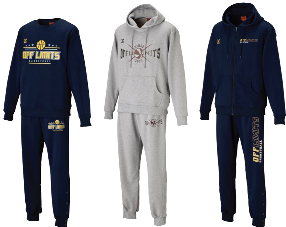
シャツ・パンツセット