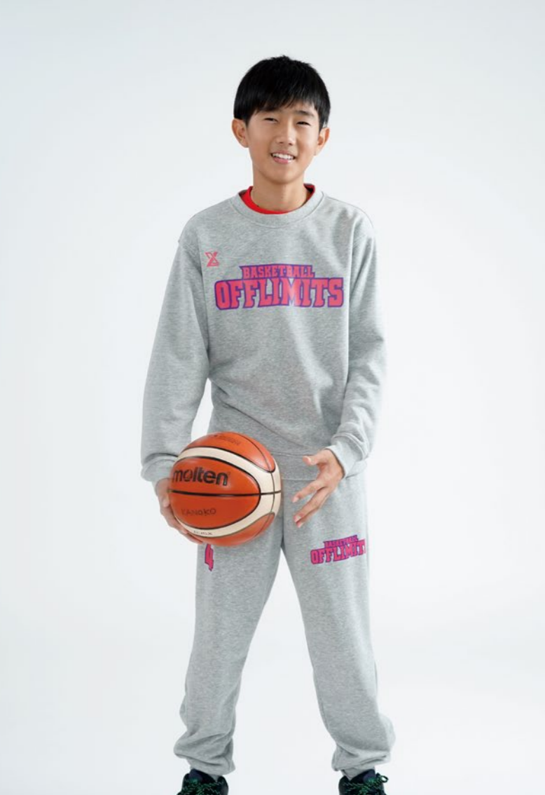
モデル身長:158cm 着用サイズ:上下SS シャツ・パンツセット