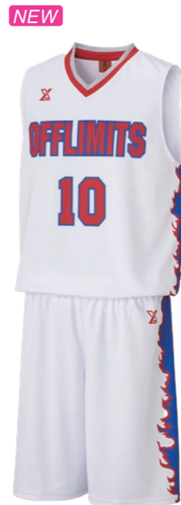
OGWJ-K07 ①ホワイト②レッド③ロイヤルブルー