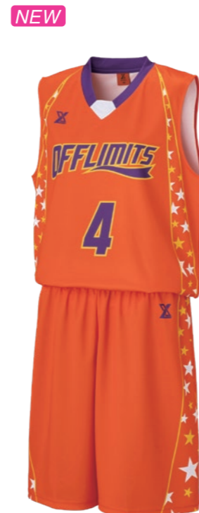
OGWJ-K08 ガールズシャツ ①オレンジ②ホワイト③イエロー