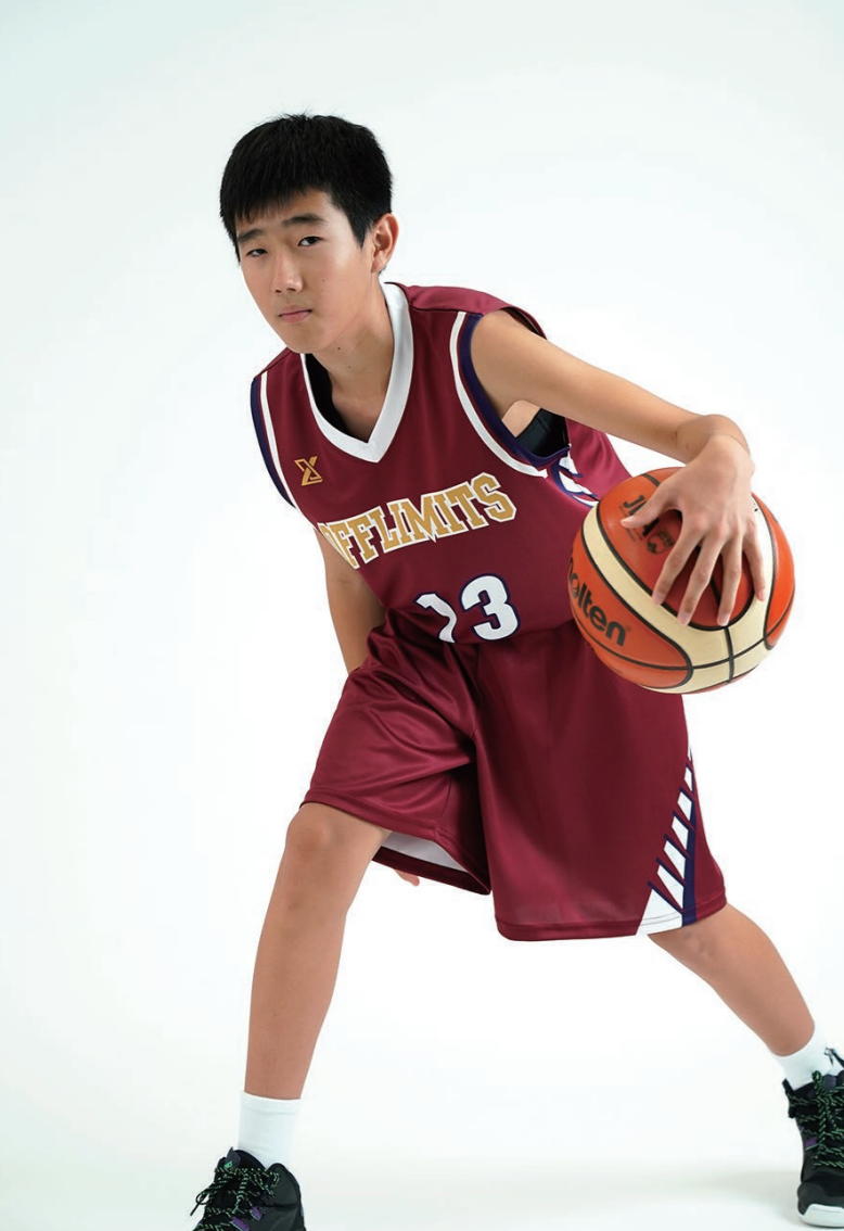
モデル身長:164cm 着用サイズ:上160、下150 ボーイズシャツ/ジュニアパンツ 着用デザイン:OGWJ-K04 ロゴ:L-5,K-9,F-2