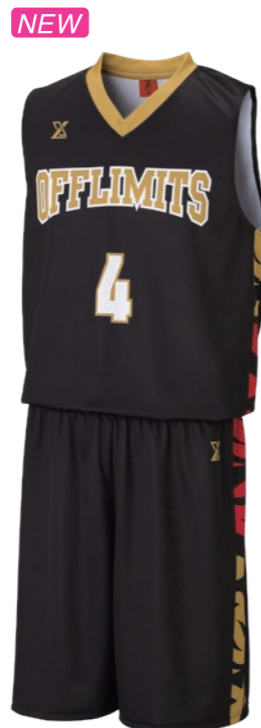
OGWJ-K06 ①ブラック②マットゴールド③レッド