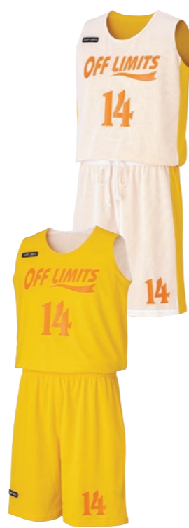
レディースシャツ