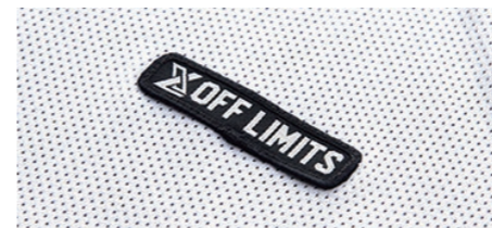
ブランドワッペン