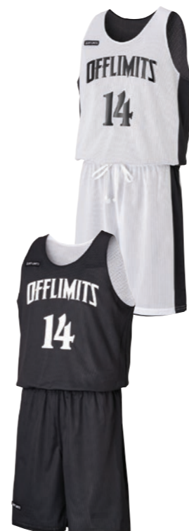
タンクトップシャツ