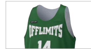
タンクトップシャツ

カットスリーブよりも肩幅が狭めの シャツタイプ。肩周りの可動域の制限 がなく、着心地良好。