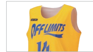
レディースシャツ

カットスリーブよりも首・袖口が狭めの シャツタイプ。インナーが見えるという 懸念を軽減。