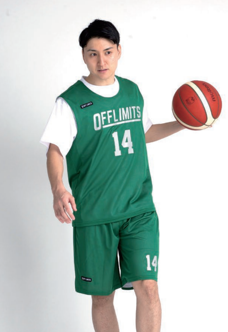
モデル身長:178cm 着用サイズ:上下LL カットスリーブシャツ/パンツセット ロゴ:L-12, K-7, F-1