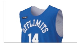
カットスリーブシャツ

肩幅のあるベーシックなシャツタイプ Tシャツの上から着用する場合、 女性チームにもこちらがおすすめ。