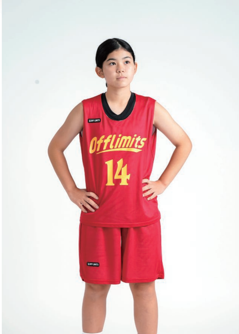
モデル身長:151cm 着用サイズ:上M, 下S レディースシャツ/パンツセット ロゴ:L-9, K-18, F-1