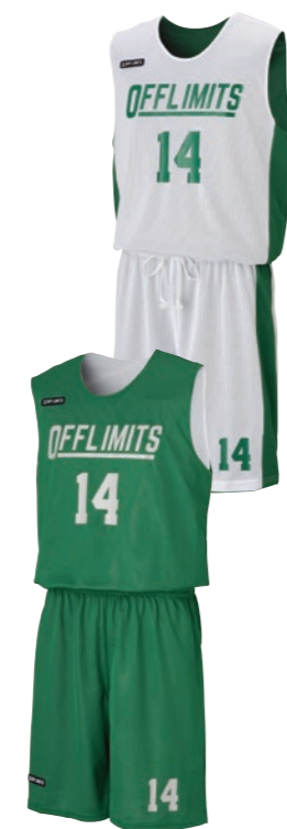
カットスリーブシャツ