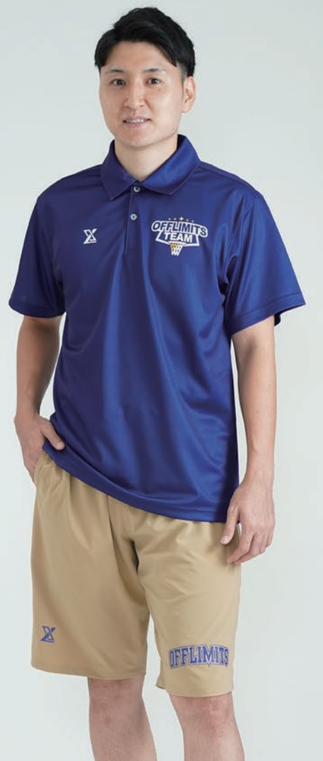
モデル身長:178cm 着用サイズ:LL ポロシャツ ロゴ:T-63