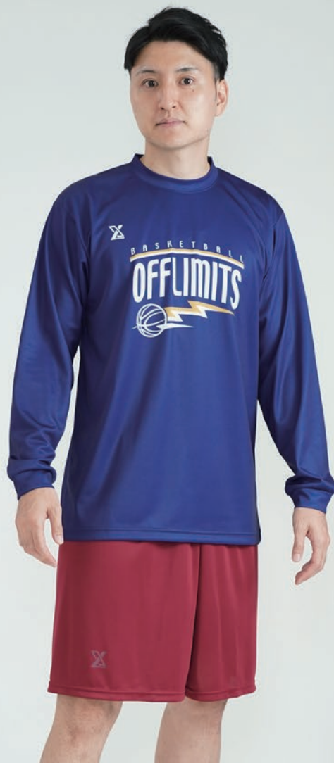
モデル身長:178cm 着用サイズ:LL ロングTシャツ ロゴ:T-62