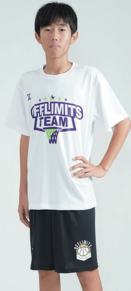
モデル身長:164cm 着用サイズ:S Tシャツ ロゴ:T-63