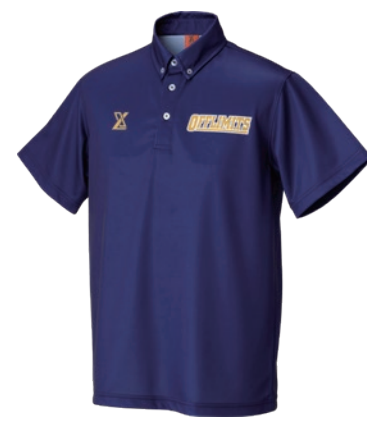
ボタンダウンポロシャツ