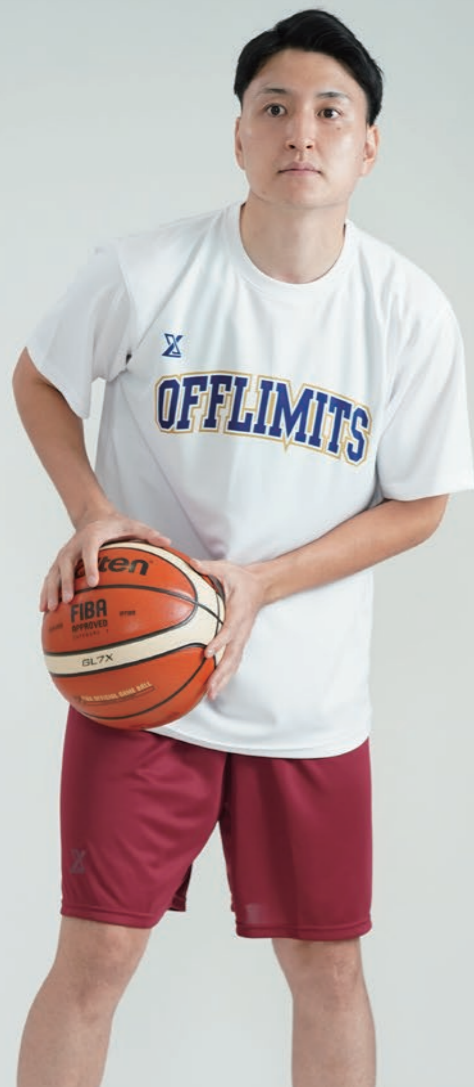
モデル身長:178cm 着用サイズ:LL プラクティスパンツ