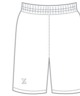
※ポケットなし仕様