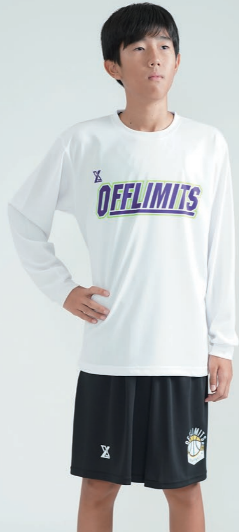
モデル身長:164cm 着用サイズ:S プラクティスパンツ ログ:T-61