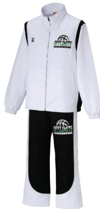
OLWB-002 ①ホワイト②ブラック③ケリーグリーン ①ブラック②ホワイト③ケリーグリーン