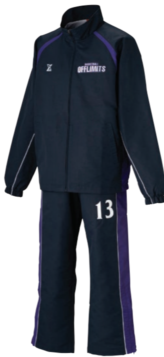
OLWB-010 ①ネイビー②パープル③ホワイト