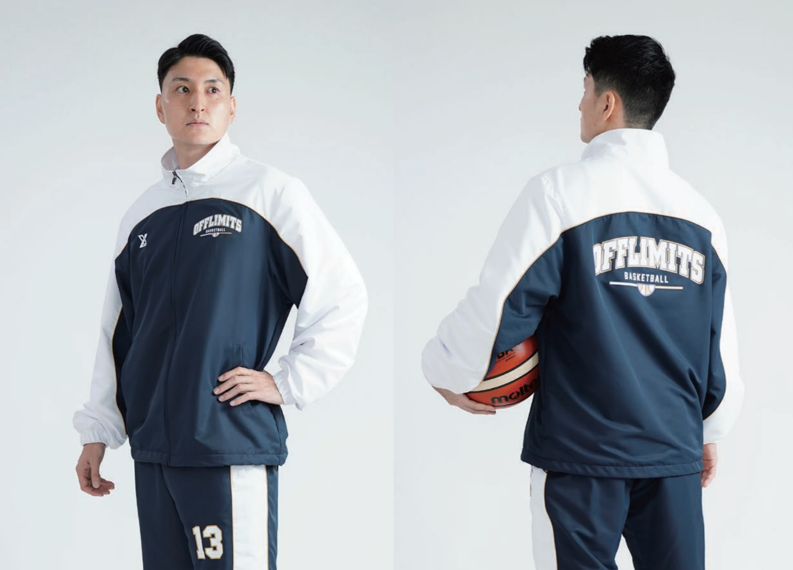
モデル身長:178cm 着用サイズ:LL 着用デザイン:OLWB-006 ロゴ:T-59