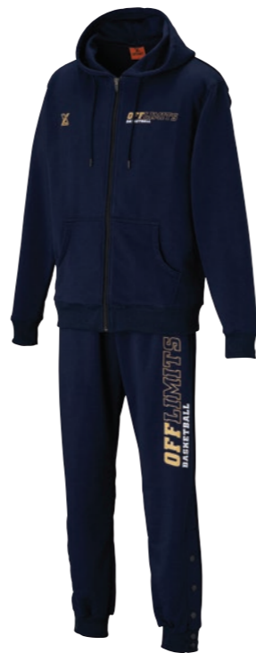
ジップパーカー・パンツセット