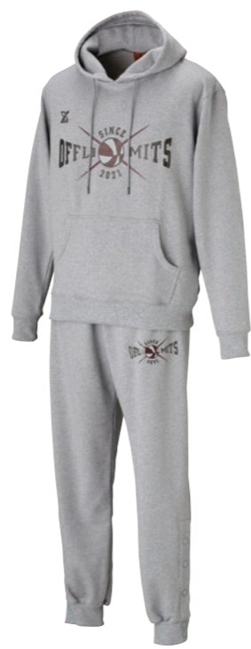
パーカー・パンツセット