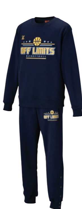
シャツ・パンツセット